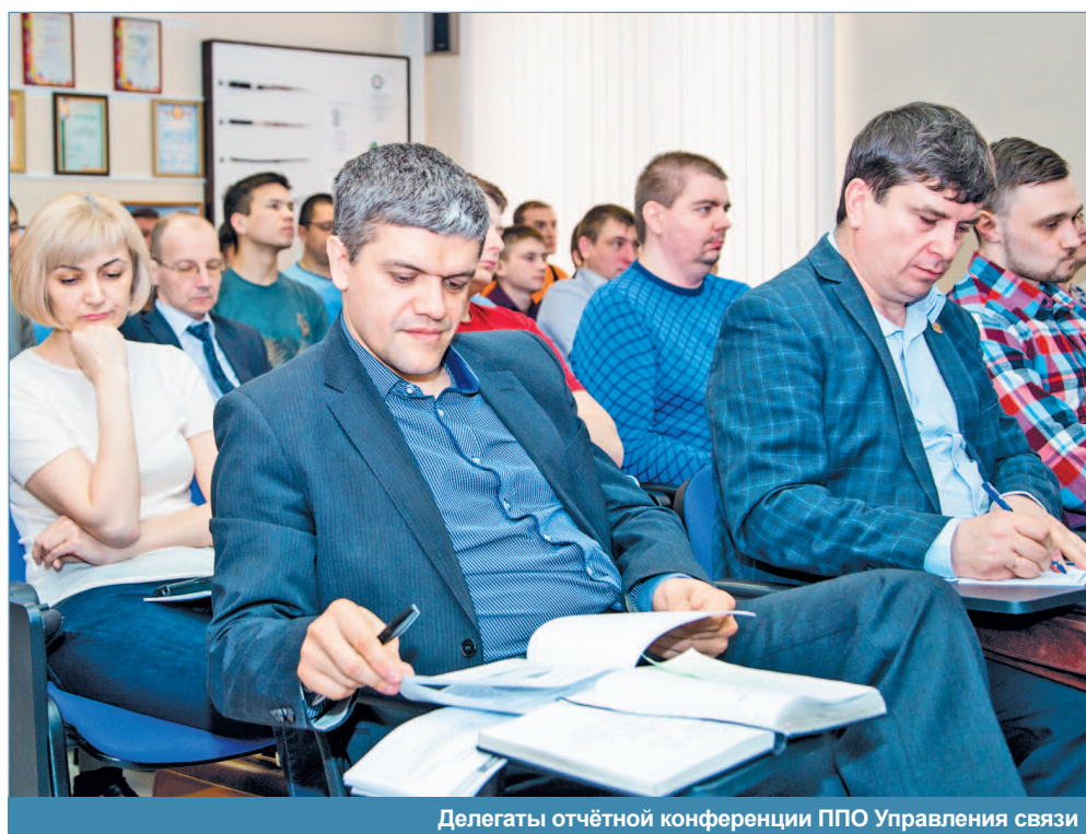
Делегаты отчётной конференции ППО Управления связи

Беседовала Елена ПЕРВУХИНА